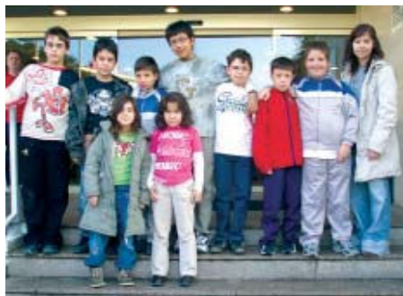
Els participants, a les Territorials escolars