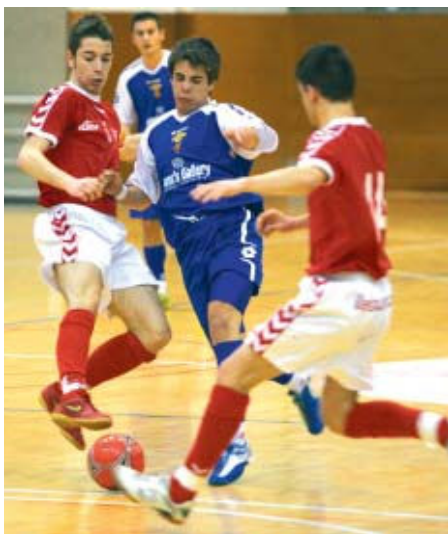
Una jugada del juvenil en el matx contra el Lluís Millet

El juvenil del CFS Montcada ha escalat fins a la cinquena posició del Grup Sisè de Nacional després dels bons resultats obtinguts a les darreres jornades i les ensopegades dels seus rivals directes. El conjunt que dirigeix Ramon Ferrés, ex tècnic del primer equip del club, centra els seus esforços en acabar la temporada a la part alta de la classificació i fer una bona campanya. Fins ara, el bloc local està assolint aquests objectius plantejats i es cinquè amb 28 punts en una categoria tant competitiva com és la de Nacional.