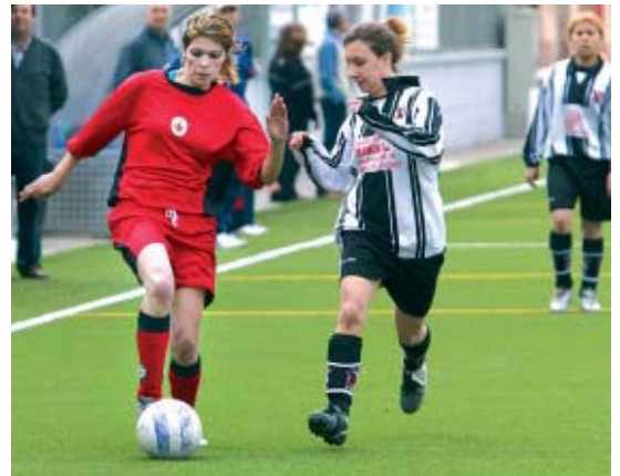
l'EF Montcada va aconseguir un espectacular 9 a 0 contra el Súrria

L'Escola de Futbol Montcada continua al primer lloc del Grup Segon de la Segona Femenina, tot i que la seva diferència s'ha escurçat als tres punts després d'encaixar la seva tercera derrota de la temporada al camp del quart classificat, el Sant Cugat Esport (2-0). Les noies d'Antonio Moya es van refer al següent partit amb una espectacular golejada contra el Súrria, per 9 a 0. Després de 20 jornades, les montcadencs són líders amb tres punts d'avantatge sobre el Rubí, que, a més, té el go a la ventaja al seu favor.