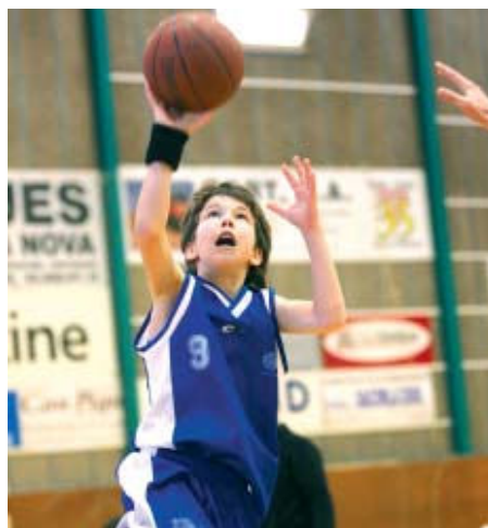
El preinfantil està fent una bona segona fase i se situa tercer