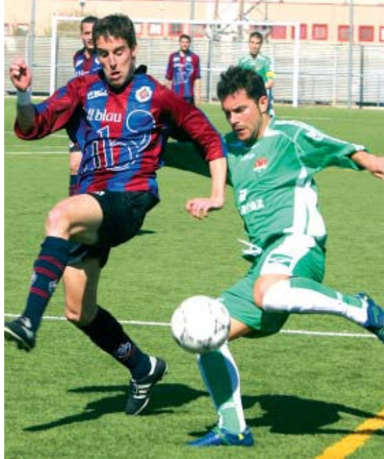
El CD Montcada respira una mica més després de sumar quatre de sis punts | SANTI ROMERO

En el desplaçament al camp de la Montañesa, Rovira i Garzón van repetir com a golejadors dels montcadencs, però les circumstàncies del partit van ser molt més heroiques. Al municipal de Nou Barris només va brillar un color,