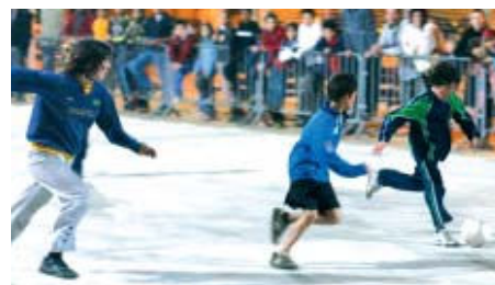
Una setantena d'infants va participar a la segona jornada

Núria Sánchez | Redacció El Mundialet de futbol sala de la Ribera, que organitzen la Xarxa de Dinamització i la Taula Cívica, va incrementar el nombre de participants a la segona jornada. Un total de 66 infants i onze equips van disputar la competició el passat 29 de febrer. Aquest cop, la meitat dels participants provenien d'altres barris com la Font Pudenta, Can Sant Joan i Montcada Centre.