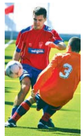
El Sant Joan segueix amb problemes | S. ROMERO

ses de la crisi del seu equip. Aquesta mala ratxa ha col·locat als montcadencs a la sisena posició amb 41 punts