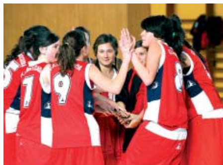
El cadet femení, celebrant la victòria contra el Sant Boi | SANTI ROMERO

Campus de Bàsquet. Una trentena d'infants participarà a la V edició del Campus de Bàsquet que tindrà lloc del 17 al 19 de març a les instal·lacions de la Zona Esportiva Centre.