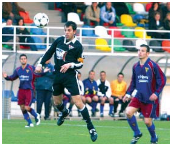
El Santa Maria va fer un molt bon partit contra el Barberà a la Ferreria

Sis dies abans de la victòria contra el Barberà, el Santa Maria va aconseguir idèntic resultat, 1 a 3 al camp del Palautordera. "Hem