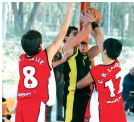
La Salle no acaba d'obtenir els resultats esperats i és cuer

darreres jornades, els locals van perdre a casa contra el Montmeló B –quart classificat– per un clar 36 a 68 i van caure a la pista del Llinars B –tercer– per 74 a 31. L'equip local s'estrena enguany a la categoria i viu un any de transició, adquirint experiència de cara a la propera temporada.