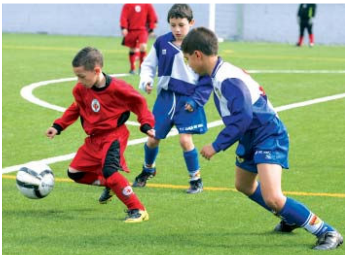
El benjamí B ha patit canvis en la part tècnica, però es manté a la part alta de la taula