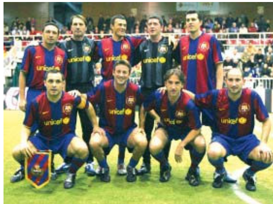
Equip del FC Barcelona que va jugar a l'últim partit disputat a Montcada

drid, que ha jugat un partit més. El seu rival, l'Atlètic, és cinquè amb sis punts després d'haver guanyat al Sevilla i l'Atlètic i perdre amb el Reial Madrid i el Deportivo. D'aquí al final de la primera edició d'aquest torneig, el FC Barcelona encara jugarà dos partits més a Montcada: el 4 d'abril contra l'Atlètic i el 16 de maig amb el València.