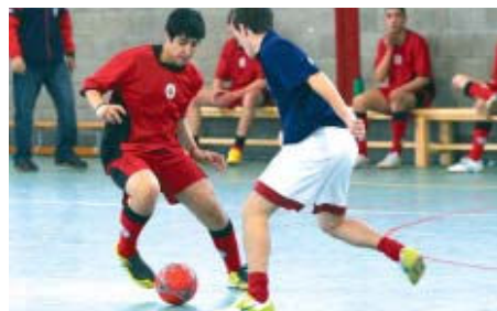
El juvenil A no abandona les darreres posicions | SANTI ROMERO

al Grup Primer de Segona Divisió, és desè amb 19 punts. En les darreres jornades, els locals han empatat a 3 amb el Santvicentí i van imposar-se al Martorelles per un clar 10 a 1.