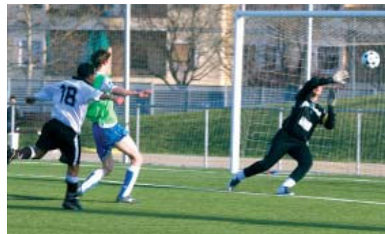
El Santa Maria B no va tenir problemes per superar un flux Llaveneres | SANTI ROMERO

El Santa Maria B ha entrat en la dinàmica de deixar-se fora de casa els punts que aconsegueix al seu propi camp. Després de donar la sorpresa en derrotar al líder, l'Argentina, a la Ferreria, l'equip que entrena Víctor Ortega va caure de forma contundent a Cabrera per 5 a 1. Una setmana després, els montcadencs van aprofitar la visita del cuer el Llaveneres, per aconseguir un còmode 2 a 0. Tretzen amb 18 punts, els seus propers rivals seran el Sant Fost i el Masnou Atlètic.