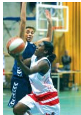
Madrid, en una acció contra el SESE

La desitjada reacció del Valentine femení no acaba d'arribar. Amb només dues victòries en 20 jornades, les noies de Josan García es mantenen a l'últim lloc del Grup Primer de Primera Catalana. Els seus dos últims partits van tenir el mateix desenllaç en forma de derrota. A la 20a jornada, el segon classificat, el SESE, va passar com un cicló per la Zona Esportiva Centre. Les montcadencs no van arribar a fer 40 punts i van perdre per 38 a 67. Al següent partit, contra un rival de la part mitja baixa de la taula com el GEIEG B, el Valentine va tenir una mica més d'opcions, però també va acabar perdent, 71 a 56. Abans de la Setmana Santa, les montcadencs jugaran dos partits a casa en dos dies seguits (14 i 15 de març); l'ajornat, corresponent a la desena jornada, contra el Banyoles i el derbi del Vallès davant el líder, el BF Cerdanyola. RJ