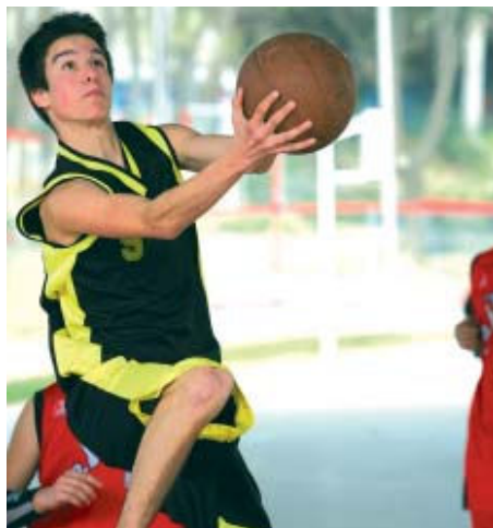
El cadet perd un matx inesperat i cau a diverses posicions